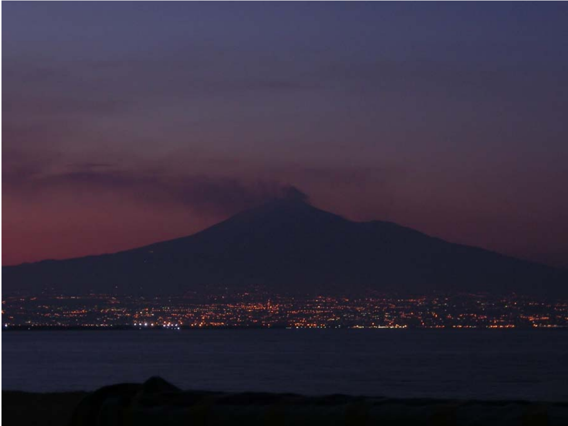
Fig. 3 - 03 Agosto 2008 (h. 20.30 ca., ora locale): l'Etna vista dalla costa meridionale del Golfo di Catania. Il "rosso" della colata è poco visibile, a conferma della forte diminuzione del tasso effusivo; il degassamento è rientrato nei limiti del "normale funzionamento" del vulcano.