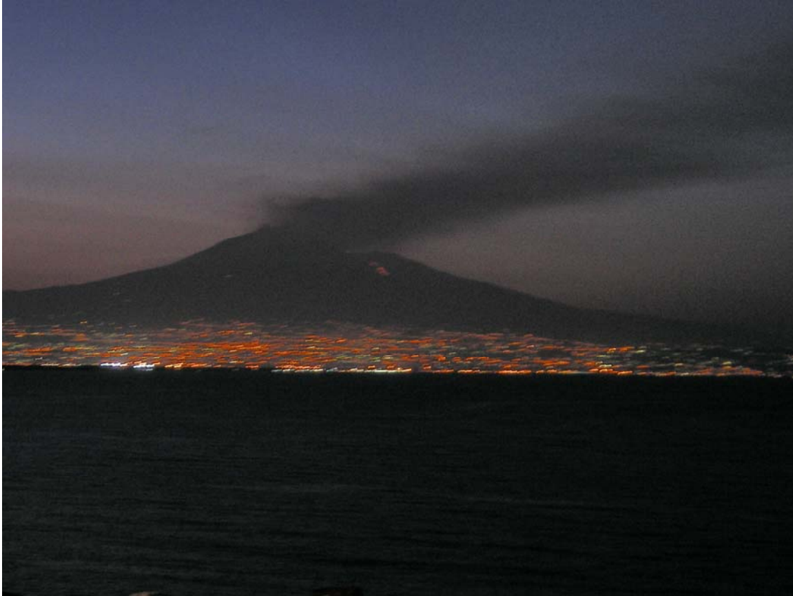
Fig. 2 - 19 luglio 2008 (h. 20.30 ca., ora locale): l'Etna vista dalla costa meridionale del Golfo di Catania. E' ben visibile la colata ben alimentata che scende nella Valle del Bove ed il vistoso plume prodotto dal forte degassamento della frattura eruttiva e dei Crateri Sommitali.