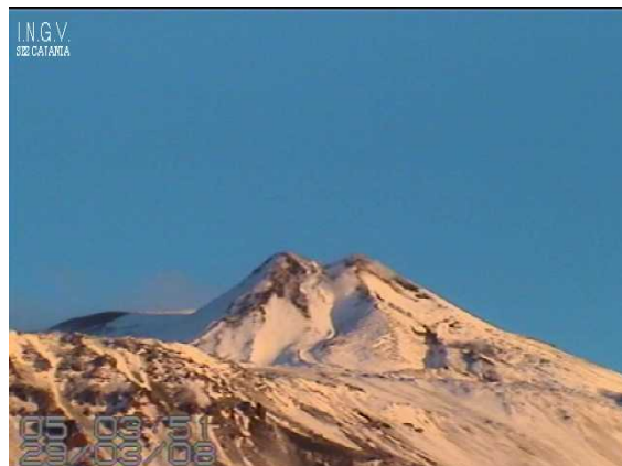
Fig. 2: A sinistra: immagine registrata dalla telecamera di Milo il 29 marzo 2008; E' chiaramente visibile l'emissione di gas dal Cratere di Nord-Est. A destra: Immagine del Cratere di Sud-Est registrata dalla telecamera posta sulla Schiena dell'Asino (bordo meridionale della Valle del Bove).