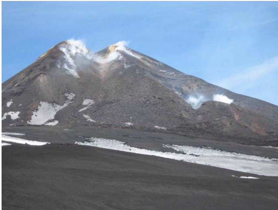
Fig. 2: Cratere di Sud-Est visto dalla zona del Belvedere (bordo occidentale della Valle del Bove). A destra è visibile il gas emesso dal pit crater attivo alla base del cono.