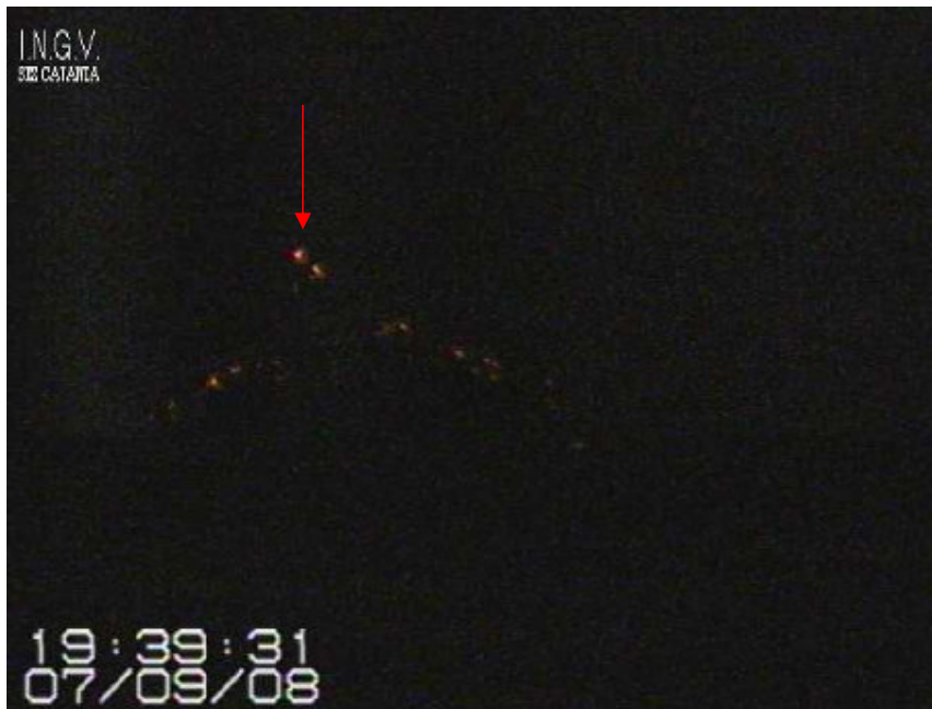
Fig. 3 - Immagine ripresa dalla telecamera INGV, Sezione di Catania posizionata a Milo che mostra la modesta attività esplosiva dalla frattura eruttiva di quota 2800 m slm il 7 settembre (evidenziata dalla freccia) accompagnata da un lieve aumento di emissione lavica.