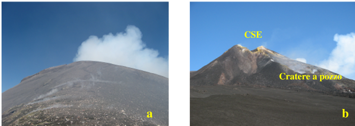
Figura 5. a) Intensa attività di degassamento del cratere di NE. b) vista panoramica da sud-est del cratere di SE (CSE) e del cratere a pozzo.

I valori di flusso di SO 2 rilevati all'Etna con la rete FLAME e con le traverse eseguite con mini-DOAS da autovettura hanno mostrato, nel periodo 1-7 settembre, una media di 3000 t/d con un massimo di ~4000 t/d raggiunto il 3 settembre. Tale aumento è stato progressivo ed accompagnato da un analogo incremento del tremore vulcanico, come segnalato nel rapporto WKRVG20080904, e potrebbe essere collegato al successivo incremento nell'intensità dell'attività eruttiva in corso.