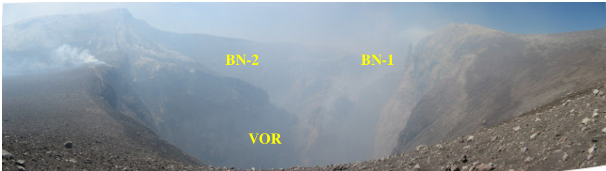
Fig. 4 - Vista panoramica ripresa il 4 Settembre dei crateri sommitali dall'orlo settentrionale della Voragine.