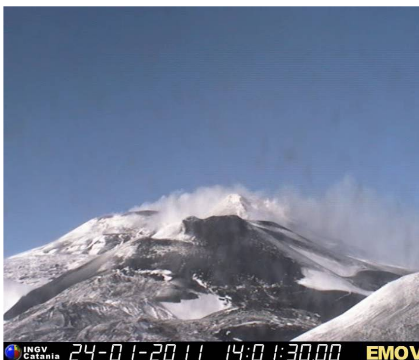
Fig. 1.1 - Panoramica dei crateri sommitali, ripresa giorno 24 Gennaio dalla telecamera del sistema di sorveglianza dell'INGV di Catania ubicata presso la Montagnola, nella quale si osserva il blando degassamento del cratere di Sud-Est.

Durante il periodo in esame l'attività ai crateri sommitali dell'Etna è stata osservata da S. Giammanco mediante le immagini delle telecamere della rete di sorveglianza INGV-CT. Non è stato possibile effettuare un sopralluogo in area sommitale causa condizioni meteorologiche avverse per gran parte della settimana. Durante la settimana in esame non sono state rilevate significative variazioni di attività.