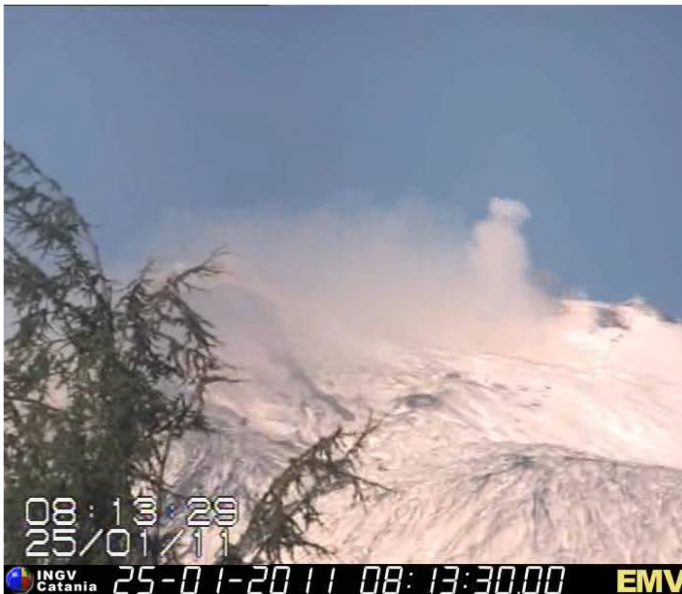
Fig. 1.2 - Panoramica dei crateri sommitali, ripresa giorno 25 Gennaio dalla telecamera del sistema di sorveglianza dell'INGV di Catania ubicata presso Milo, nella quale si osserva una emissione gassosa di tipo impulsivo dal cratere di Nord-Est.