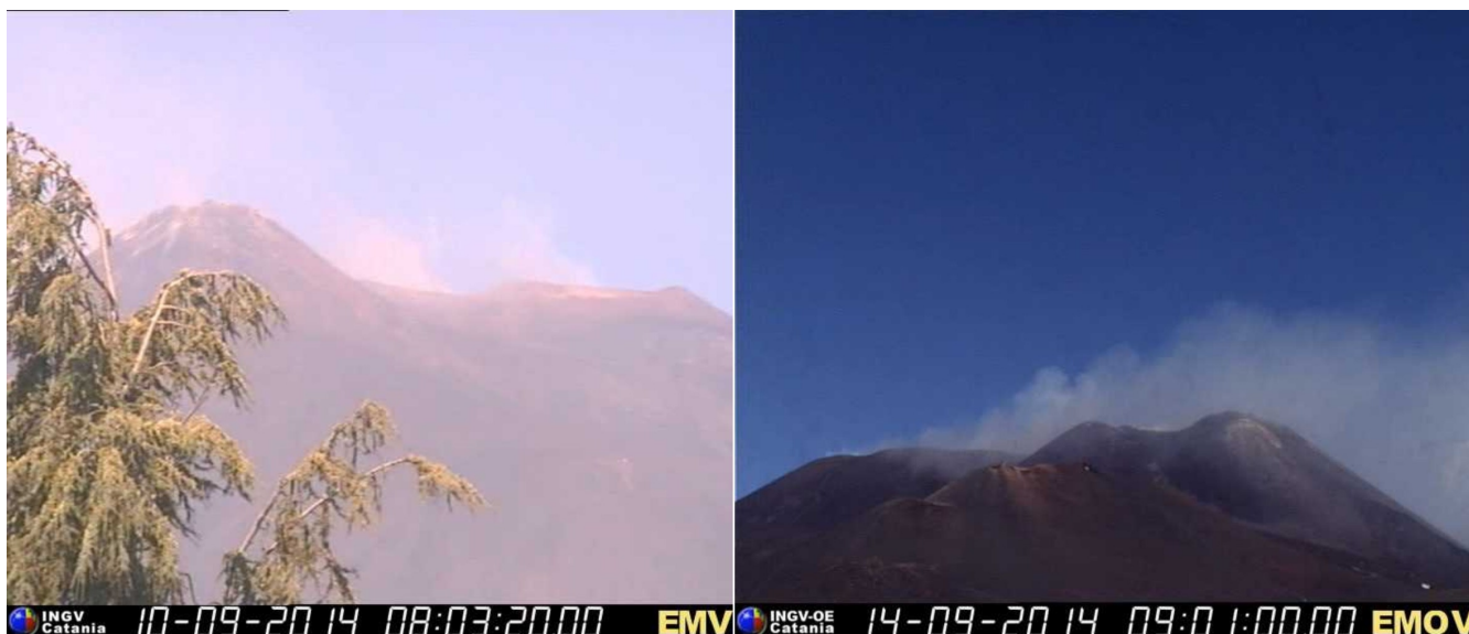
Fig. 1.2 - Immagini riprese dalle telecamere visibile poste a Milo (a sinistra) e alla Montagnola (a destra) che mostrano il normale degassamento dai crateri sommitali.