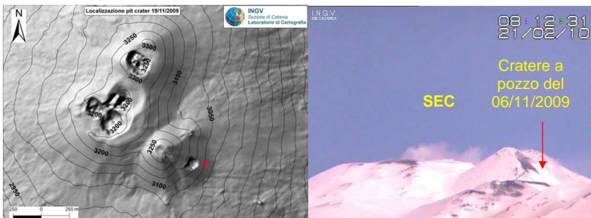
Fig.1- Dem Agosto 2007, il pallino rosso rappresenta il Cratere a pozzo alla base del CSE, visibile nel frame a destra dalla telecamera Nicolosi.

Il flusso di SO 2 emesso dall'Etna, misurato dalla rete FLAME e con traverse eseguite con tecnica DOAS da autovettura, nel periodo compreso tra il 15 ed il 21 febbraio 2010, ha mostrato valori medi inferiori a quelli della scorsa settimana. I valori giornalieri hanno mostrato valori di picco rilevanti (>9000 t/d). Nel loro complesso i valori medi di flusso durante la settimana hanno mostrato un trend in incremento.