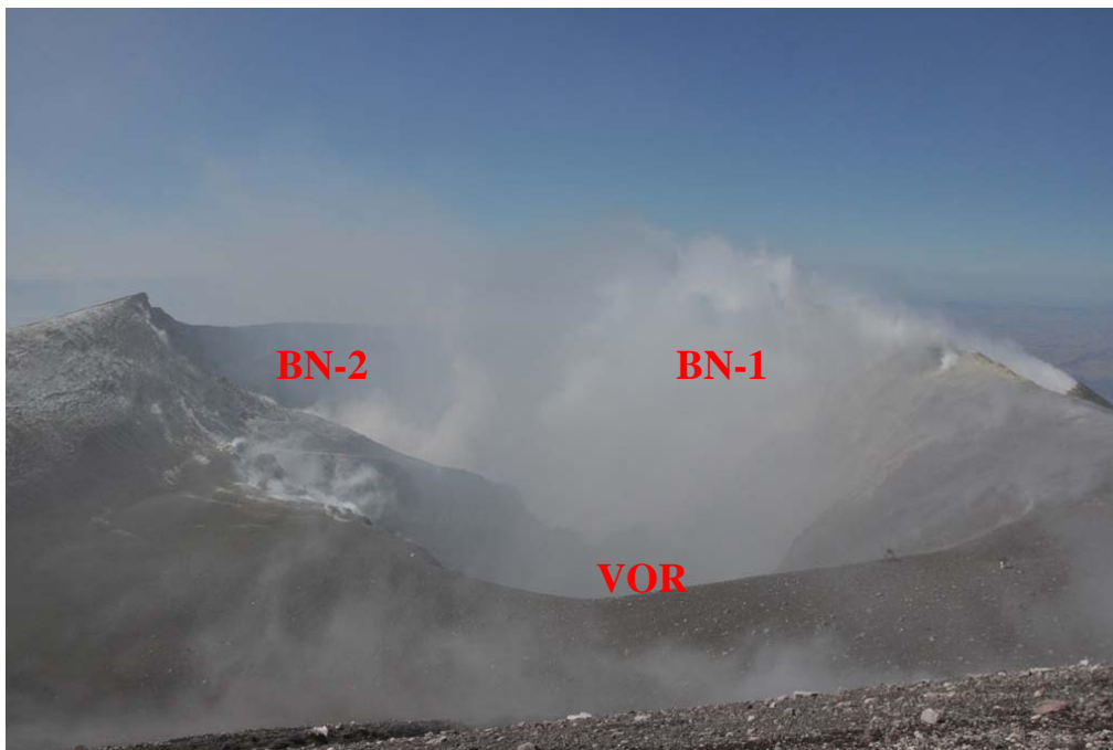
Figura 3 – Giorno 18 settembre. Degassamento alla Bocca BN-1 del Cratere Bocca Nuova. Non si osserva degassamento dal fondo del cratere Voragine (VOR) e dalla bocca BN-2 del Cratere Bocca Nuova.

Al Cratere di Nord Est è presente un'emissione continua di gas dal fondo (Figura 4 A e B). Durante il sopralluogo sono stati uditi boati profondi con una frequenza di circa 10-15 minuti. Come riferito da alcune guide alpine, boati sono stati uditi nel corso di tutta la settimana.