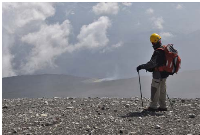
Figura 5 – Giorno 18 settembre. Degassamento nella zona apicale della fessura eruttiva dell'eruzione 2008-09.

Continua anche il degassamento nella porzione apicale della fessura eruttiva che ha alimentato l'eruzione 2008-09 (Figura 5).