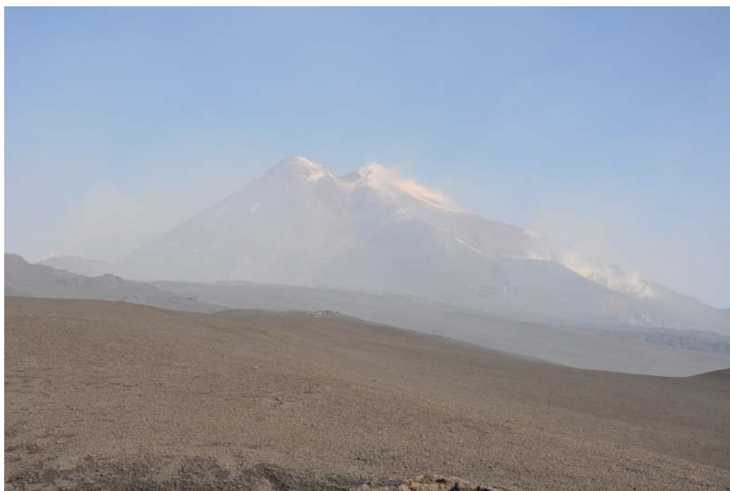
Figura 1 – Degassamento alle fumarole sull'orlo craterico e nella depressione presente lungo il fianco orientale del Cratere di Sud Est.

Al cratere di Sud Est l'attività di degassamento si è concentrata alle fumarole presenti sull'orlo craterico e soprattutto lungo il fianco orientale del cono (Figura 1).