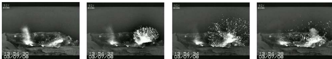
Fotogrammi di una esplosione tipo osservata alla bocca Bn_2

È da evidenziare alla bocca bN_2 che: giorno 30 Giugno, in alcuni periodi della giornata l'attività è stata particolarmente intensa (la frequenza delle esplosioni ha raggiunto i 16 eventi/h) e giorno 3 Luglio l'aumentata apertura della bocca ha mostrato una distribuzione molto ampia dei prodotti che, in alcuni casi, hanno raggiunto i limiti dell'area craterica ( vedi Sequenza di esplosione tipo)