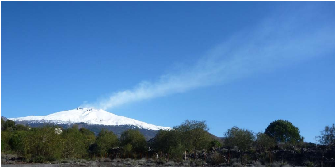
Figura 3 – Degassamento dell'Etna visto da Nicolosi la mattina del 18 marzo.

Il 18 marzo l'attività di degassamento, ben visibile da tutti i crateri, ha formato un vistoso pennacchio di gas sopra il vulcano (Figura 3).