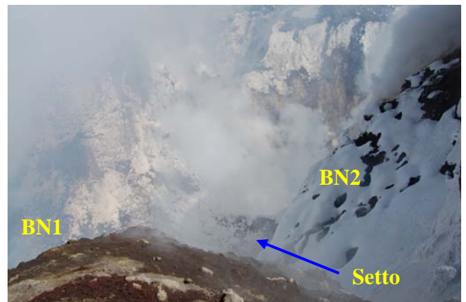
Figura 4 – Il setto divisorio tra i 2 pit-crater della Bocca Nuova ricoperto di neve.

Durante la ricognizione in area sommitale sono state svolte osservazioni presso la Bocca Nuova, dove era presente un degassamento pulsante ma intenso che tuttavia per brevi periodi di tempo (della durata di pochi secondi) ha lasciato intravedere la morfologia interna. I due pit-crater che compongono la Bocca Nuova (BN1 e BN2; Figura 1) apparivano separati sul fondo craterico soltanto da un piccolo setto divisorio alto poche decine di metri (Figura 4).