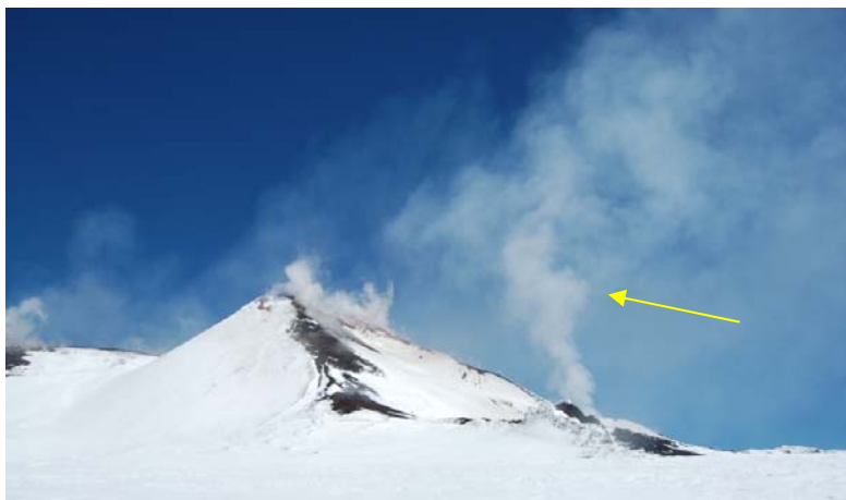
Figura 6 – Il Cratere di SE visto dal versante meridionale del vulcano. La freccia indica il degassamento proveniente dal pit-crater che risale verticalmente in un periodo di scarsa intensità del vento.

Non è stato possibile raggiungere il pit-crater presso il Cratere di SE, che tuttavia ha mostrato un degassamento pressoché continuo (Figura 6) e a tratti di colore leggermente scuro, come se l'intenso flusso di gas portasse in sospensione del particolato molto fine e diluito.