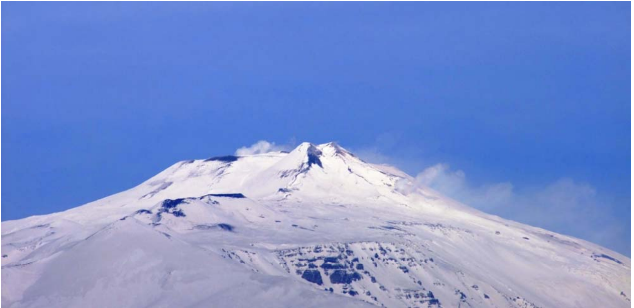
Fig. 2. I Crateri Sommitali dell'Etna ed il cratere a pozzo l'11 ed il 13 febbraio 2010.