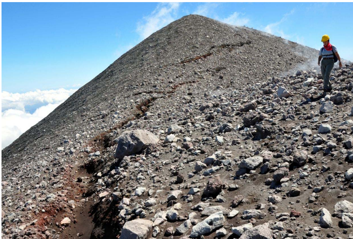
Fig. 7 – Campo di fratture concentriche ( lunar crack ) alla depressione centrale del Cratere di Nord-Est.