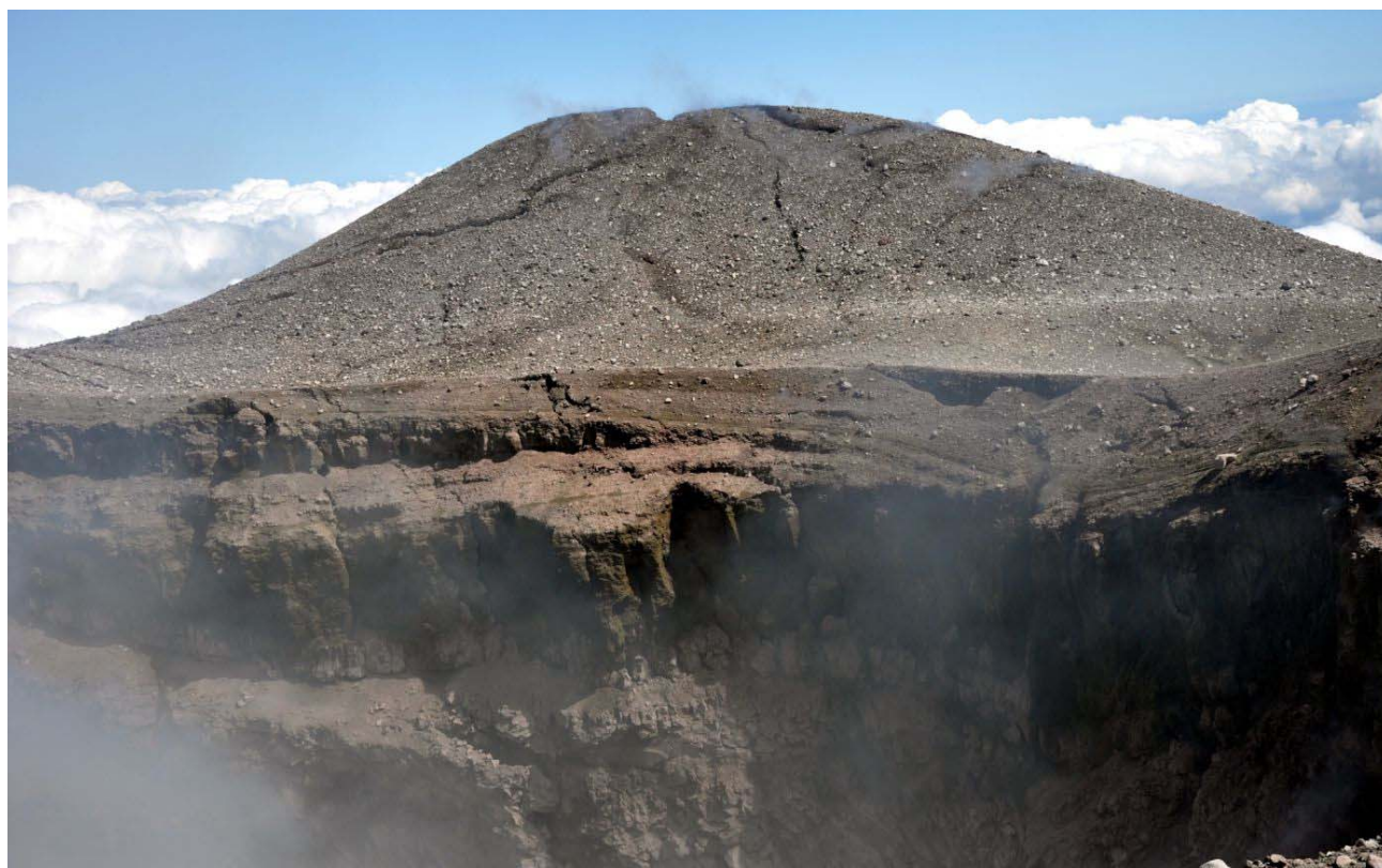
Fig. 6 – veduta interna del Cratere di Nord-Est (NEC). Si notano numerose fratture beanti che tagliano il cratere, destabilizzando il suo orlo e provocando continui franamenti lungo le pareti interne.

Il Cratere di Nord-Est (NEC) è anche interessato da vistose fratture del suolo, molte delle quali hanno avuto origine durante le fasi iniziali dell'eruzione 2008-2009. Si tratta sostanzialmente di due gruppi di fratture; il primo è orientato circa NO-SE, taglia il bordo orientale del NEC, poi lo attraversa al suo interno risalendone la parete interna settentrionale, fino a superarne l'orlo ed a proseguire all'esterno del cratere con direzione NO (vedi Fig. 6).