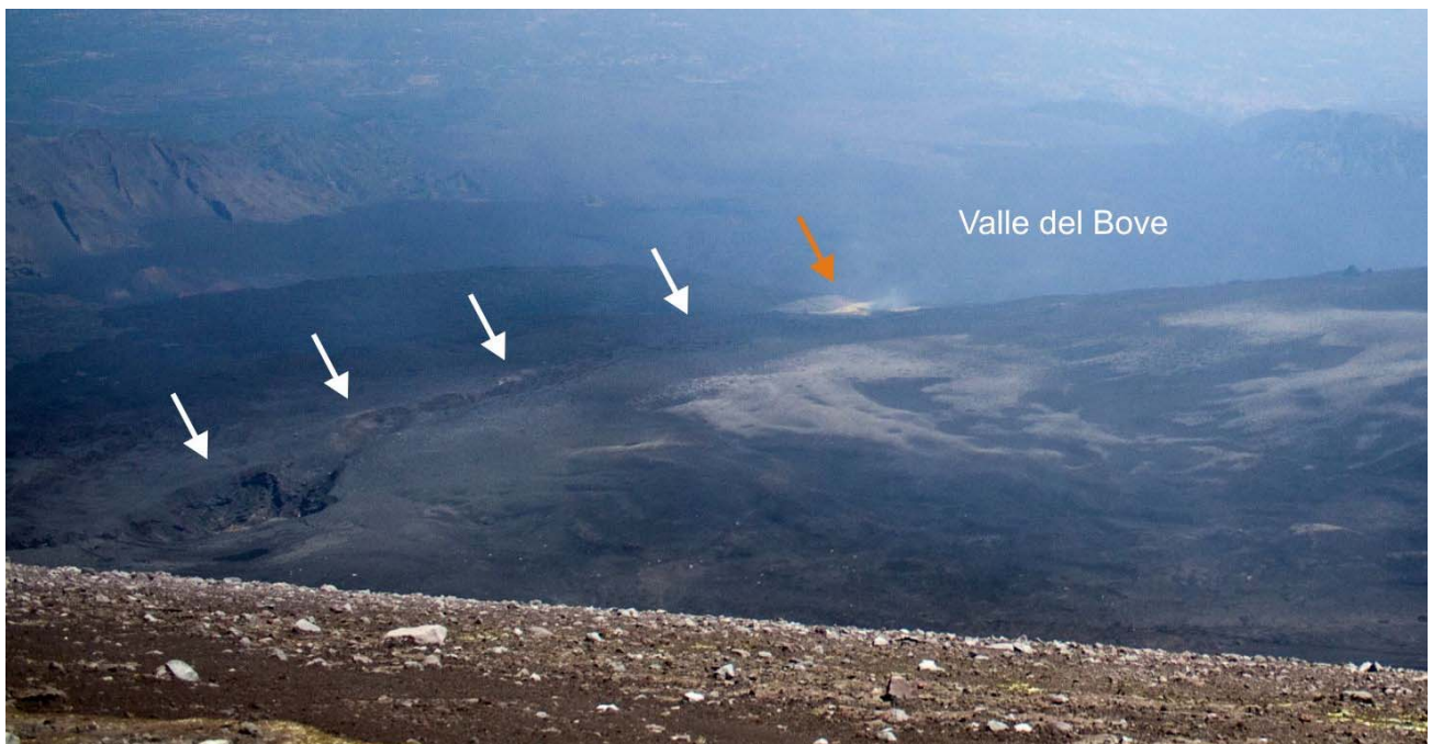
Fig. 2 – Fessura eruttiva del 2008-2009 (vedi frecce). L'attività effusiva si è totalmente esaurita il 6 Luglio scorso, ma continua un'intensa attività fumarolica dalla porzione inferiore della fessura (freccia color arancio).

Anche il Cratere di Sud-Est (SEC – Fig. 3) mostra intense attività fumaroliche concentrate soprattutto sulla sua sommità ed in corrispondenza della depressione craterica localizzata sul fianco orientale del cono.