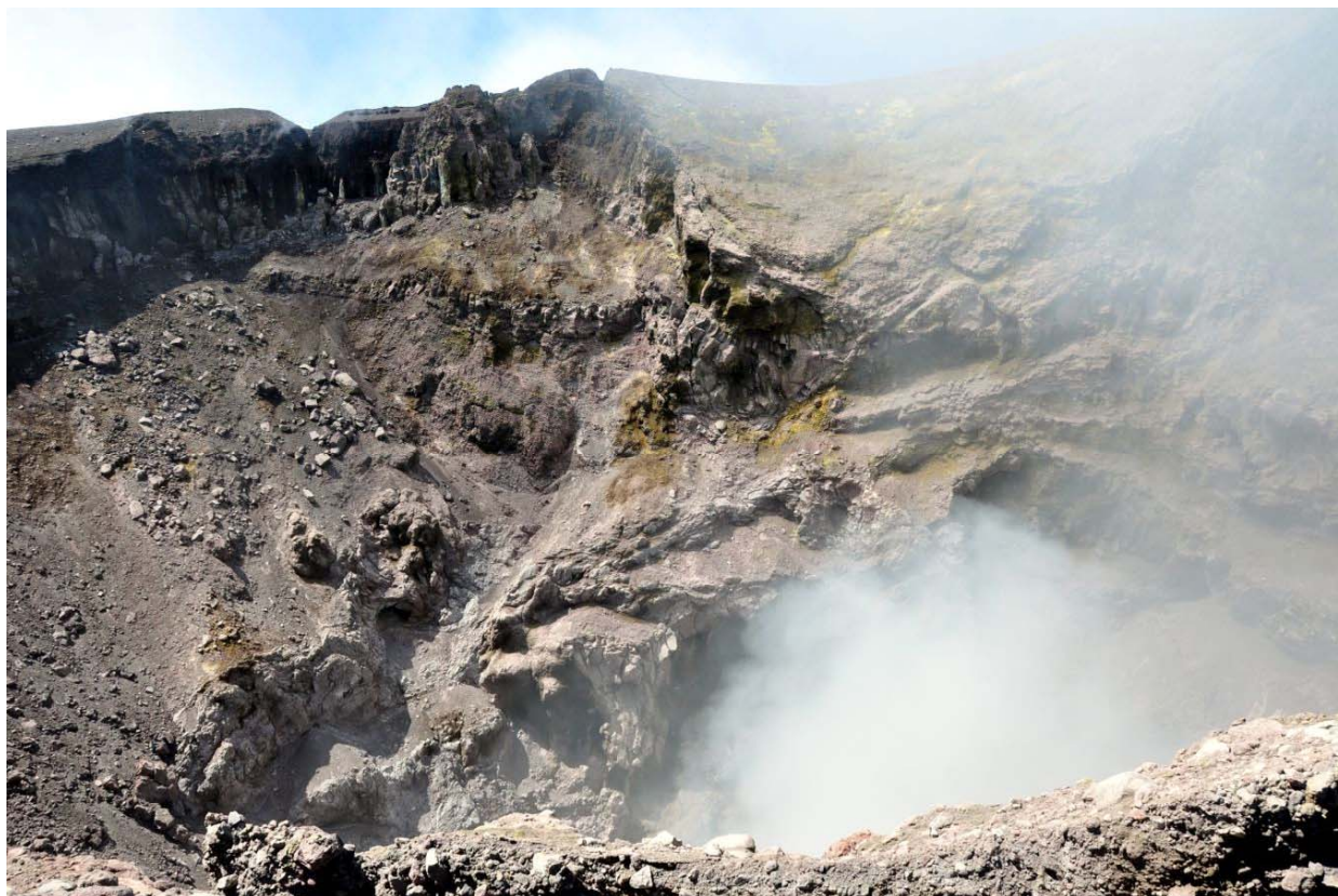
Fig. 5 – Veduta dell’interno del Cratere di Nord-Est (NEC). L’attività esplosiva che avviene all’interno del suo condotto si manifesta in superficie attraverso boati e successive volute di gas .

Il Cratere di Nord-Est (NEC, vedi Fig. 5) è caratterizzato da attività esplosiva non visibile in superficie, ma che avviene presumibilmente ad alcune centinaia di metri di profondità rispetto al suo orlo. Tale attività è percepibile come sordi boati seguiti, dopo circa 5-10 secondi, da boli di vapore e gas che emergono dal fondo del cratere (vedi Fig. 5).