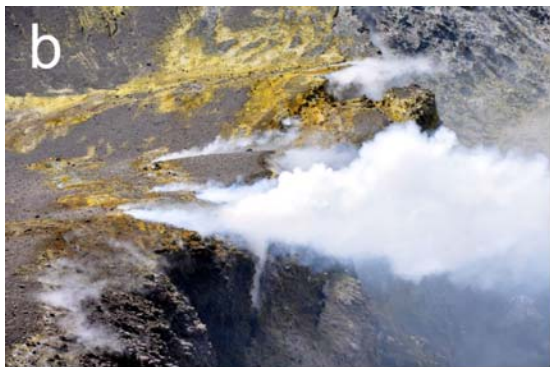
Figura 4 - Il Cratere centrale dell'Etna, frazionato in Voragine (VOR) e Bocca Nuova (BN), quest'ultima a sua volta separata in due crateri (NW e SE). Nel Gennaio 2006 l'attività esplosiva del Cratere Centrale (Giammanco et al., 2007) ha determinato la formazione di un'unica depressione, successivamente rimodellata attraverso continui collassi intracaterici che hanno interessato soprattutto la VOR e che hanno portato alla ricostituzione di un setto roccioso divisorio tra la VOR e la BN (vedi particolare "c"). Attualmente è presente un intenso degassamento dalla BN-NW (indicata dalla freccia rossa), oltre a numerose fumarole presenti anche sul bordo orientale della VOR (vedi particolare "b").

Il Cratere Centrale (CC) del vulcano presenta, in questi ultimi giorni, vistose ed intense attività di degassamento (Fig. 4).