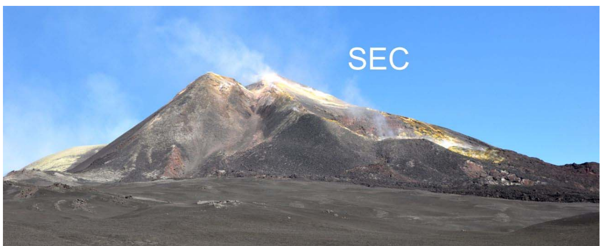
Fig. 3 – Cratere di Sud-Est (SEC) visto da Sud.

Anche il Cratere di Sud-Est (SEC – Fig. 3) mostra intense attività fumaroliche concentrate soprattutto sulla sua sommità ed in corrispondenza della depressione craterica localizzata sul fianco orientale del cono.