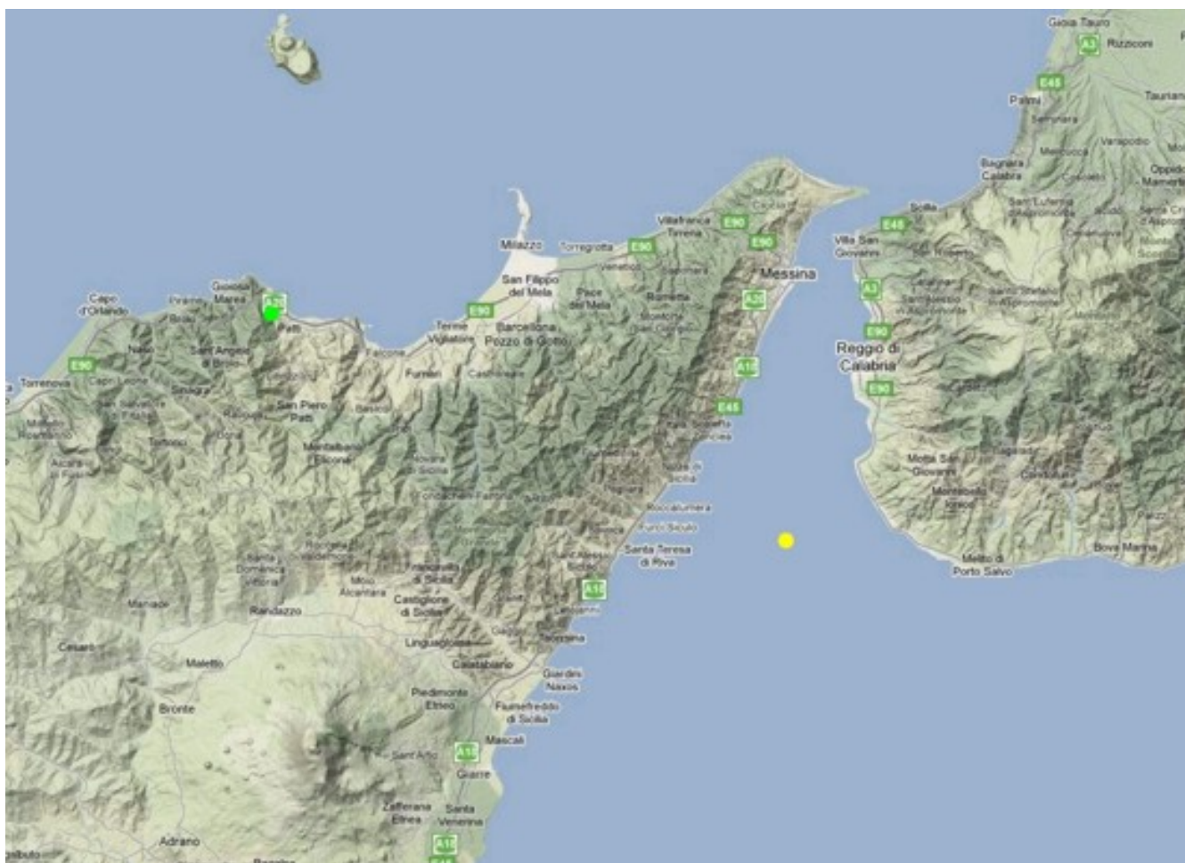
Fig. 1.2 Mappa della sismicità localizzata nell'area della Sicilia Nord-Orientale e Calabria meridionale nella settimana 14-20 giugno 2010