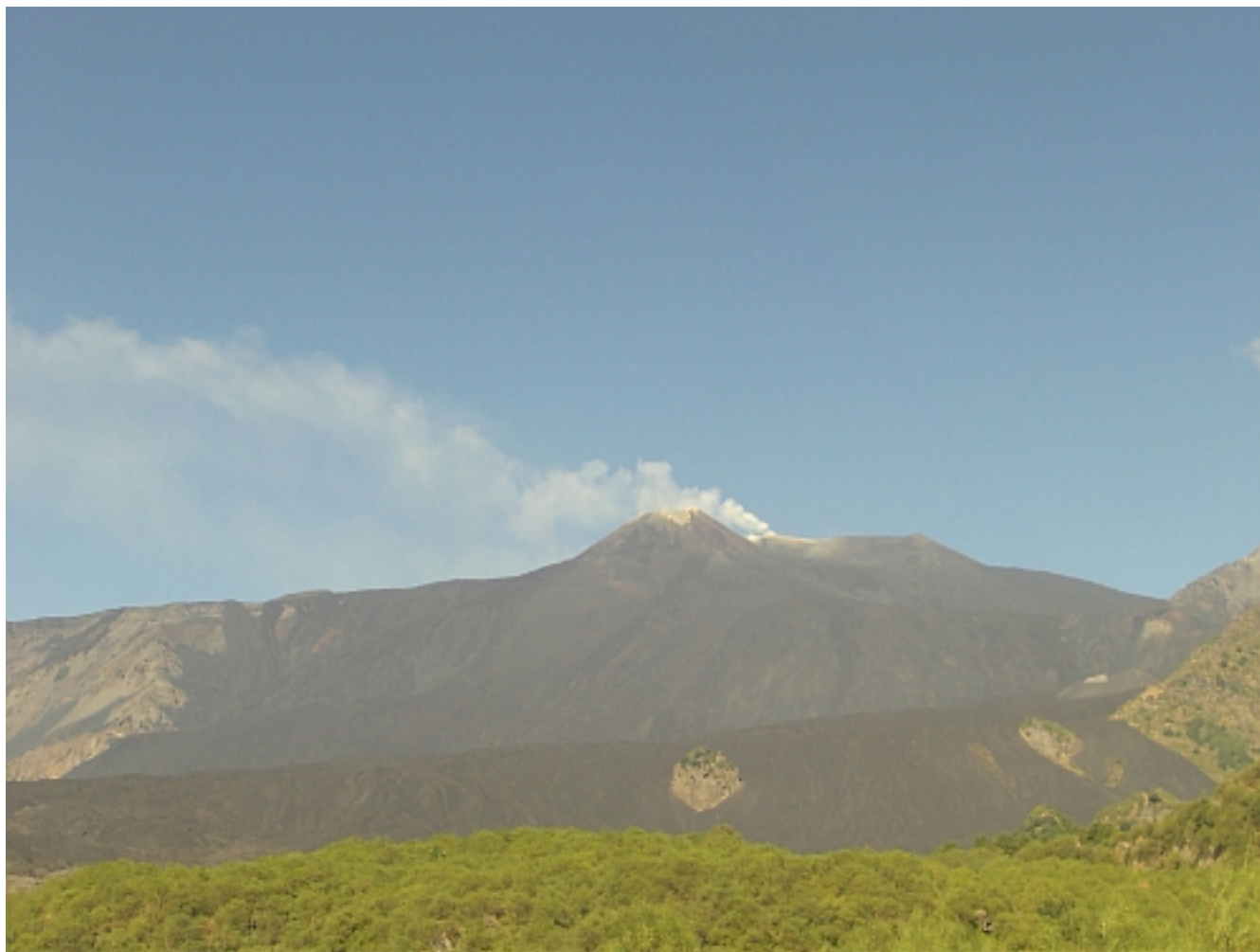
Fig. 1.2 - Fig. 1.2 - Immagine ripresa della telecamera visibile ad alta risoluzione di Monte Cagliato (EMCH) giorno 06 settembre alle 08.02 GMT, dalla quale si osserva il prevalente regime di degassamento alimentato dal cratere VOR e le modeste emissioni di natura fumarolica del SEC-NSEC.