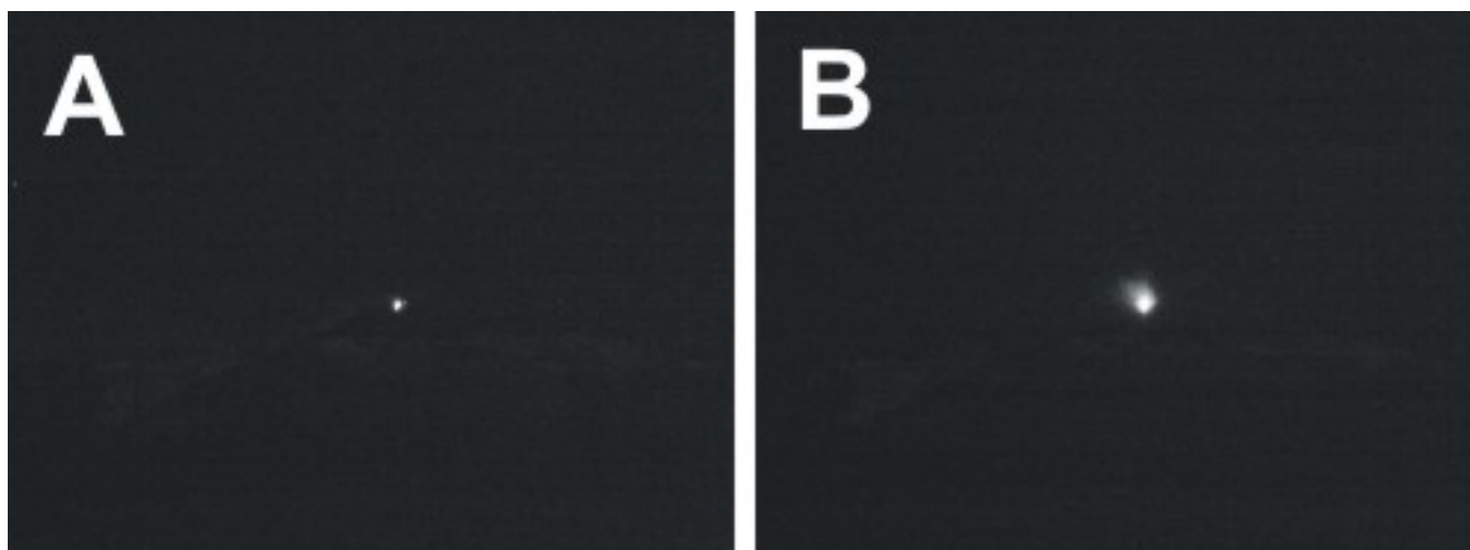
Fig. 1.2 - Figura 1.2 - Immagini all'infrarosso registrate dalla telecamera ad alta definizione ubicata a Monte Cagliato, sul fianco orientale dell'Etna, che mostrano le esplosioni avvenute dal cratere a pozzo sull'alto fianco orientale del Nuovo Cratere di SE, rispettivamente (A) il 29 dicembre alle 04:47 UT e (B) il 30 dicembre alle 04:33 UT.

diluita, che si disperdeva nelle immediate vicinanze del cratere. Nessun evento esplosivo ha interessato il NCSE il 31 dicembre, ma il 1 gennaio alle 01:30 UT una nuova sequenza esplosiva di bassa intensità è stata rilevata da due bocche all'interno del cratere a pozzo che interessa l'alto fianco orientale del NCSE. Questa attività è diventata pressoché continua il giorno successivo, rimanendo sempre di intensità molto bassa e confinata all'interno del cratere a pozzo del NCSE.