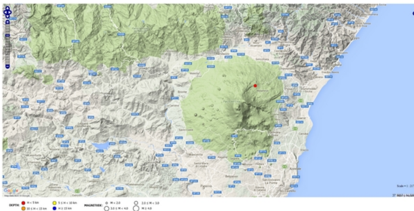
Fig. 3.2 - Mappa della sismicità localizzata nella settimana 28 dicembre 2015 - 3 gennaio 2016.

In particolare, l'evento sismico (fig. 3.2), registrato il 29/12 alle 15:29 GMT (MI=2.1), ha interessato il versante settentrionale del vulcano (1.7 km E da Monte Nero (CT)).