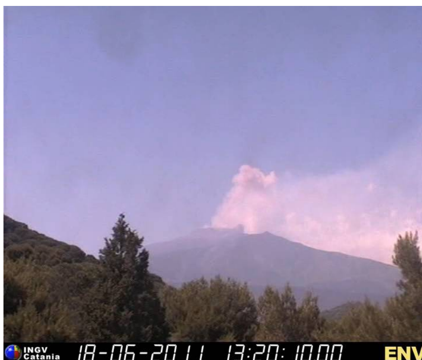
Fig. 1.4 - Emissione di cenere ripresa dalla telecamera di sorveglianza di Nicolosi il giorno 18 Giugno alle ore 13:20 GMT. Si noti la notevole altezza (molto superiore ai 1000 m) raggiunta dalle ceneri in quella occasione.