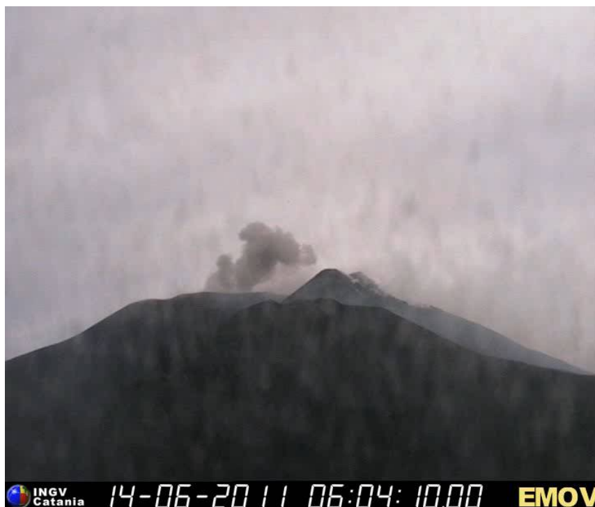
Fig. 1.2 - Attività di emissione di cenere dalla Bocca Nuova ripresa dalla telecamera di sorveglianza della Montagnola il giorno 14 Giugno.

ulteriori osservazioni più ravvicinate. In questa occasione è stato però possibile raccogliere informazioni indirette sullo stato di attività da parte delle guide dell'Etna, in particolare da G. Amendolia. Sulla base delle osservazioni effettuate e delle informazioni raccolte si è constatato che l'attività di emissione di cenere è prodotta principalmente dal cratere BN2 e secondariamente dal cratere BN1 ed è stata accompagnata saltuariamente anche da emissione di blocchi di materiale non juvenile oltre l'orlo craterico. Il miglioramento della visibilità nella serata del 17 ha permesso di osservare ulteriori emissioni di cenere a partire dalle 18:08 GMT. Il fenomeno è proseguito con intensità variabile anche il 18 e il 19 Giugno, con alcune esplosioni che occasionalmente hanno raggiunto parecchie centinaia di metri di altezza sopra i crateri sommitali (Fig. 1.4).