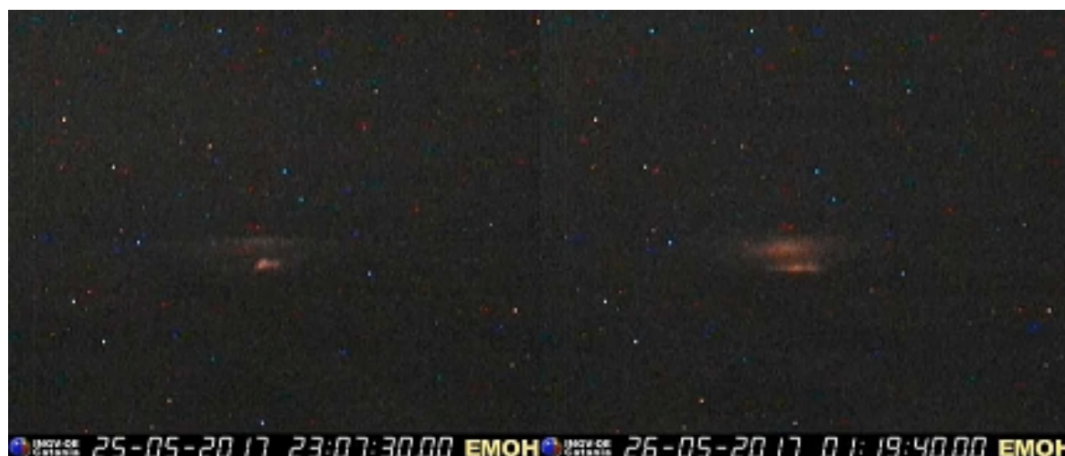
Fig. 1.2 - Immagini registrate dalla telecamera di sorveglianza EMOH il 25 ed il 26 maggio che mostrano i bagliori al Nuovo Cratere di Sud-Est.

fianchi dell'apparato eruttivo (Fig 1.3).