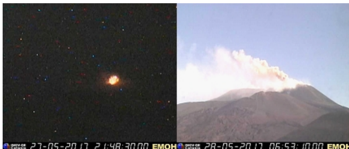
Fig. 1.3 - Immagini registrate dalla telecamera di sorveglianza EMOH durante la notte del 27 e la mattina del 28 maggio che mostrano un'esplosione al NSEC.