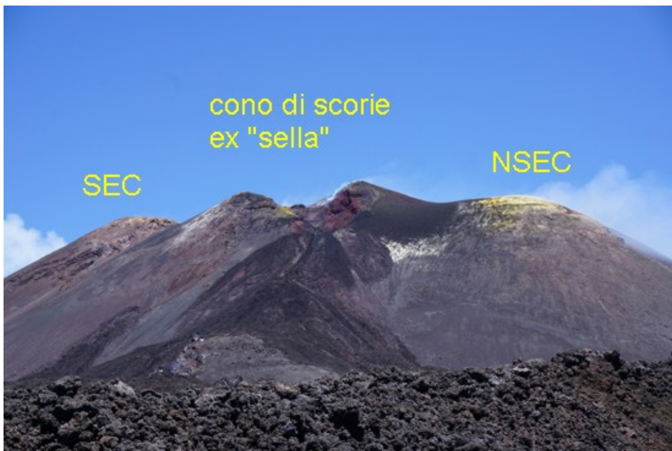
Fig. 1.2 - Immagine del 3 maggio che mostra il versante meridionale del Cratere di SE (SEC)-Nuovo Cratere di SE (NSEC) e del nuovo cono di scorie che si è formato in seguito all'attività eruttiva iniziata alla fine del mese di febbraio 2017.

Infine, sia il Cratere di SE (SEC)-Nuovo Cratere di SE (NSEC) che il recente cono di scorie localizzato nella ex "sella" fra il SEC e il NSEC sono interessati solamente da un modesto degassamento prodotto dai sistemi di fumarole presenti lungo gli orli craterici (Fig. 1.2).