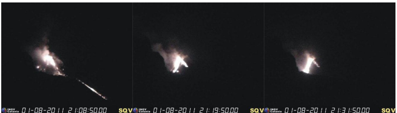
Figura 1 – Sequenza di immagini dalla telecamera visibile di quota 400 m relative ai primi 20-30 minuti di attività che mostrano: a sinistra il rotolamento di blocchi incandescenti di lava verso il basso, al centro la formazione di due colate, a destra il raffreddamento della colata più settentrionale e l'avanzamento della colata principale.

Le telecamere hanno evidenziato la formazione di 2 colate laviche, la più settentrionale delle quali, di minore entità, ha percorso poche decine di metri raffreddandosi intorno alle 21:30 UTM (Figura 1); la seconda colata lavica, invece, è apparsa sin dall'inizio della fenomenologia più alimentata essendo evidenziata da una persistente incandescenza (telecamera visibile; Figura 1) e anomalia termica (telecamera termica; Figura 2).