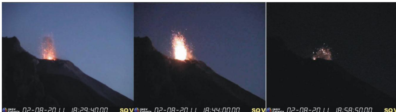
Figura 3 – Sequenza di immagini dalla telecamera visibile di quota 400 m tra le 18 e le 19 UTM che mostrano l'attività esplosiva ai crateri sommitali e la scomparsa dell'incandescenza legata alla emissione della colata lavica (vedi Figura 1 per confronto).

Anche le immagini notturne della telecamera visibile mostrano che la colata è ormai in avanzato stato di raffreddamento e non appare essere più alimentata (Figura 3).