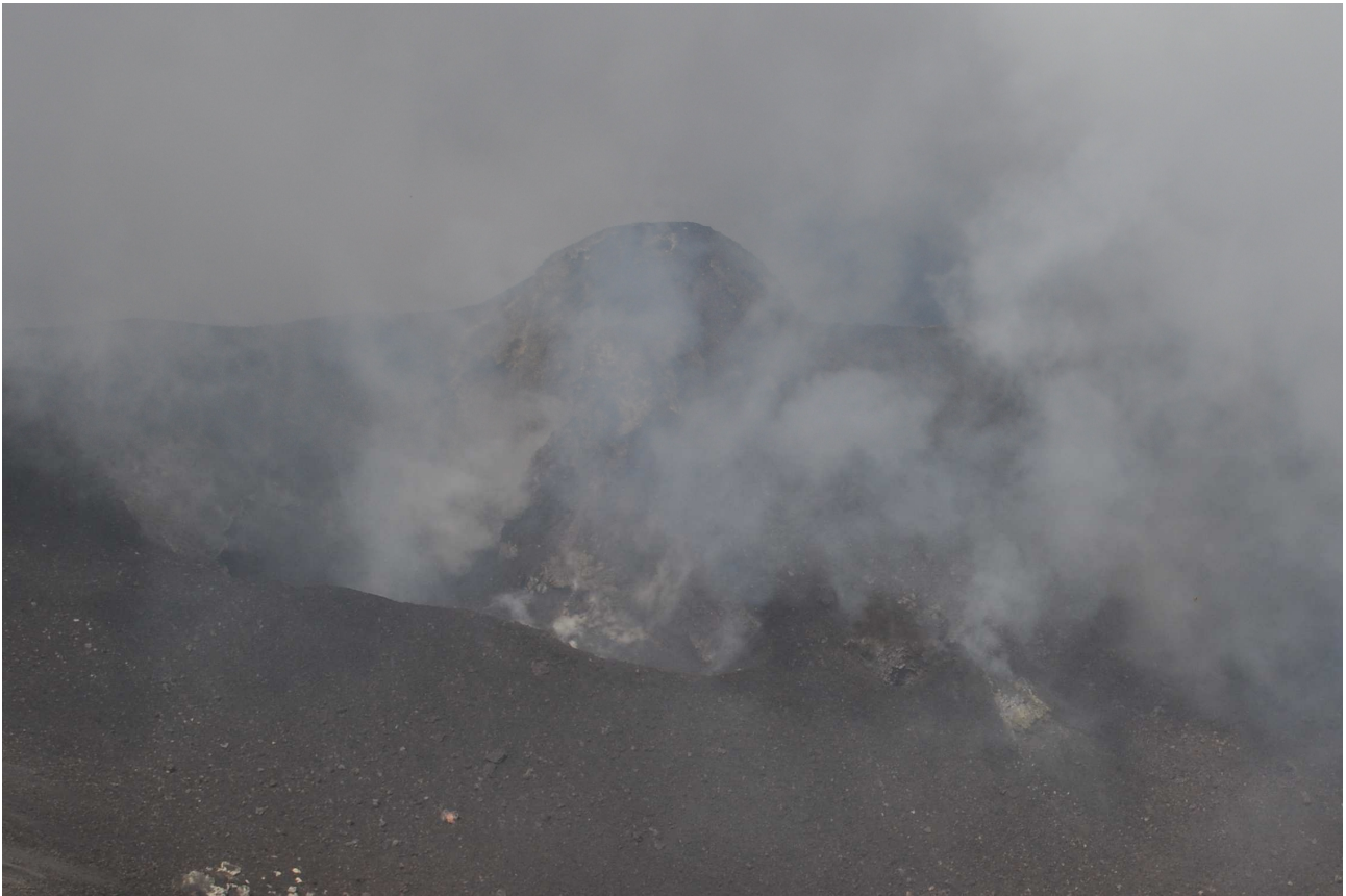
Figura 9 – In primo piano è visibile l'area craterica Sud interessata dal parossismo; subito dietro è presente il piccolo conetto di lava e scorie formatosi nel corso dell'attività degli ultimi mesi .

tuttavia, eventuali variazioni morfologiche dell'area craterica interessata dall'evento parossistico non sarebbero significative.