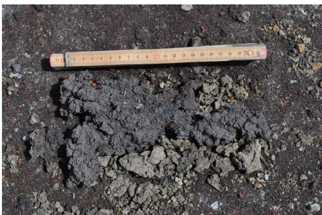
Figura 6 – Esempio di scoria scura (clasto più grosso rinvenuto sul Pizzo sopra la Fossa).