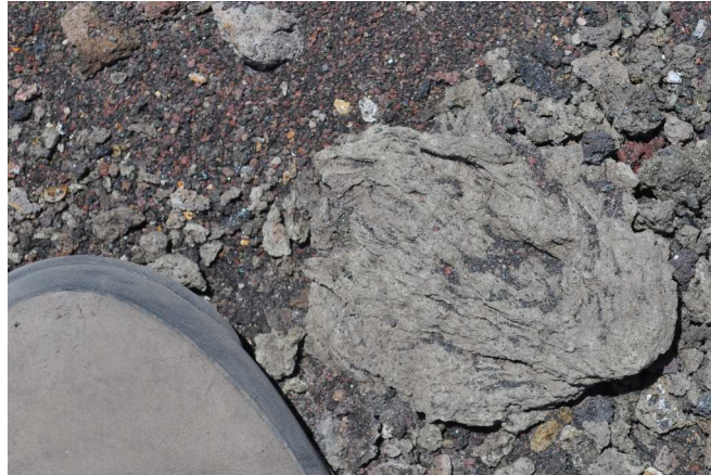
Figura 7 – Lapillo pomiceo con superficie di tipo “a crosta di pane”.