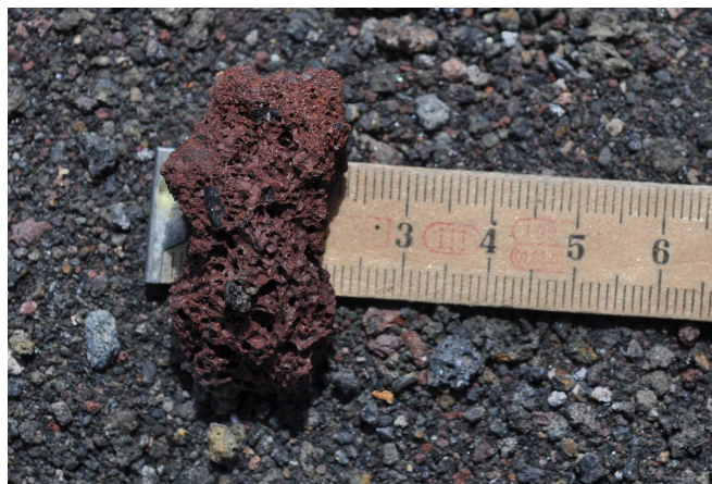
Figura 8 – Frammento litico rosso.