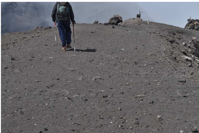
Figura 4 – L’area del Pizzo sopra la Fossa; si notano i frammenti piroclastici ricaduti in seguito all’evento parossistico.

L’area intorno al Pizzo è stata quella maggiormente interessata dalla ricaduta delle piroclastiti emesse, sebbene i prodotti ricoprono la superficie in maniera estremamente discontinua e irregolare (Figura 4).