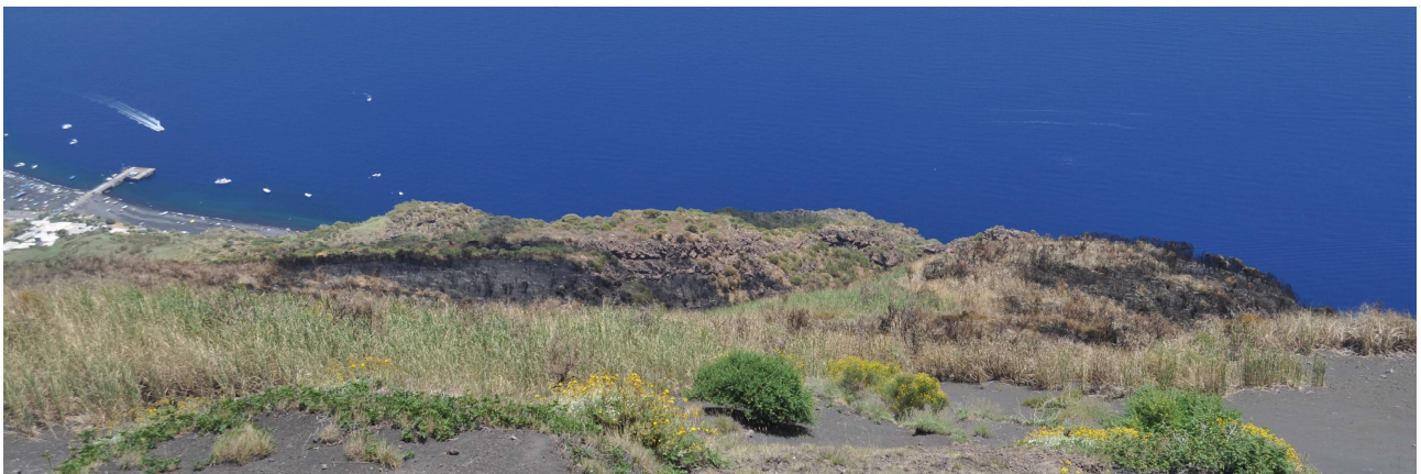
Figura 3 – Parte della vegetazione bruciata in seguito all’incendio (vista dal sentiero della Rena Grande); sulla sinistra il porto dell’isola.

Da segnalare, tuttavia, che il materiale caldo ricaduto sulle basse pendici del vulcano ha innescato dei focolai di incendio che, propagandosi verso l’alto, hanno causato un incendio di dimensioni considerevoli in una fascia di vegetazione al di sotto dei 400 m, domato dall’intervento dei Canadair (Figura 3).