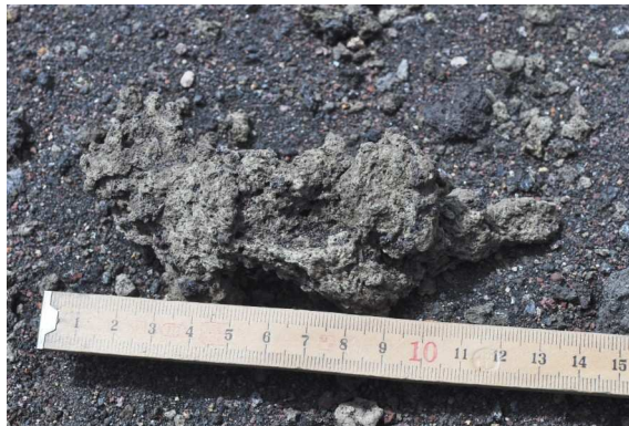
Figura 5 –Clasto decimetrico di pomice scoriacea.