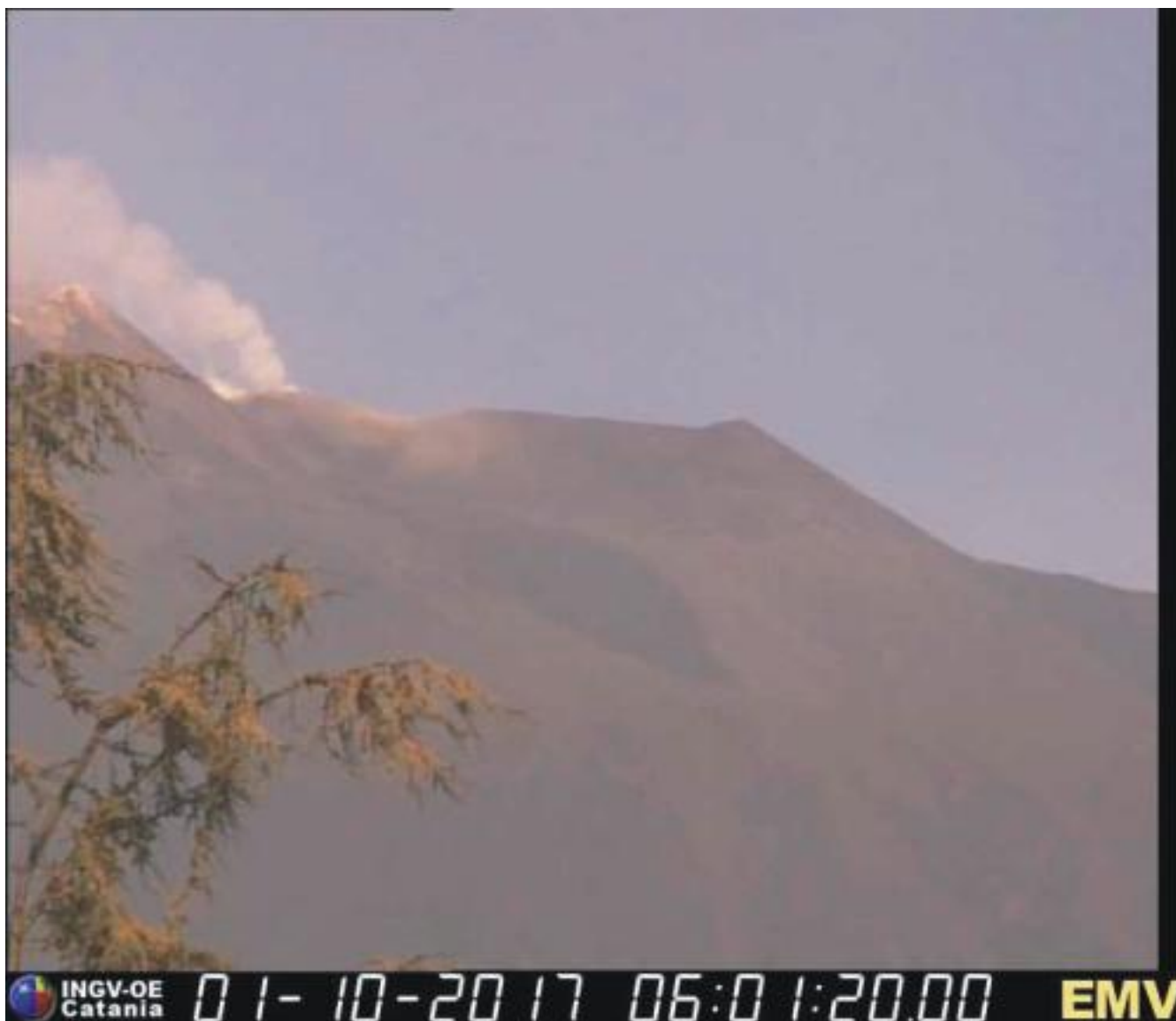
Fig. 1.2 - Degassamento dalla bocca formatasi il 7 agosto 2016 sulla parete orientale interna del Cratere Voragine ripreso dalla telecamera visibile di Milo.

Il complesso del Cratere di Sud-Est-Nuovo Cratere di Sud-Est (SEC-NSEC) continua ad essere caratterizzato un intenso degassamento accompagnato da bagliori visibili nelle ore notturne (Fig. 1.3).