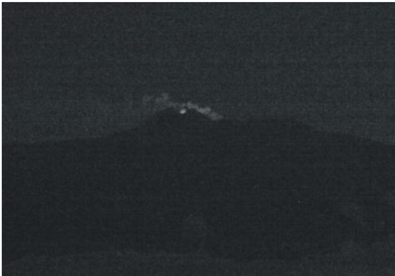
Fig. 1.3 - Bagliori in corrispondenza della bocca presente sul fianco orientale del SEC ripresi dalla telecamera ad alta sensibilità di Monte Cagliato (EMCH) sul fianco orientale del vulcano, giorno 30 settembre alle ore 4:11 UTC.