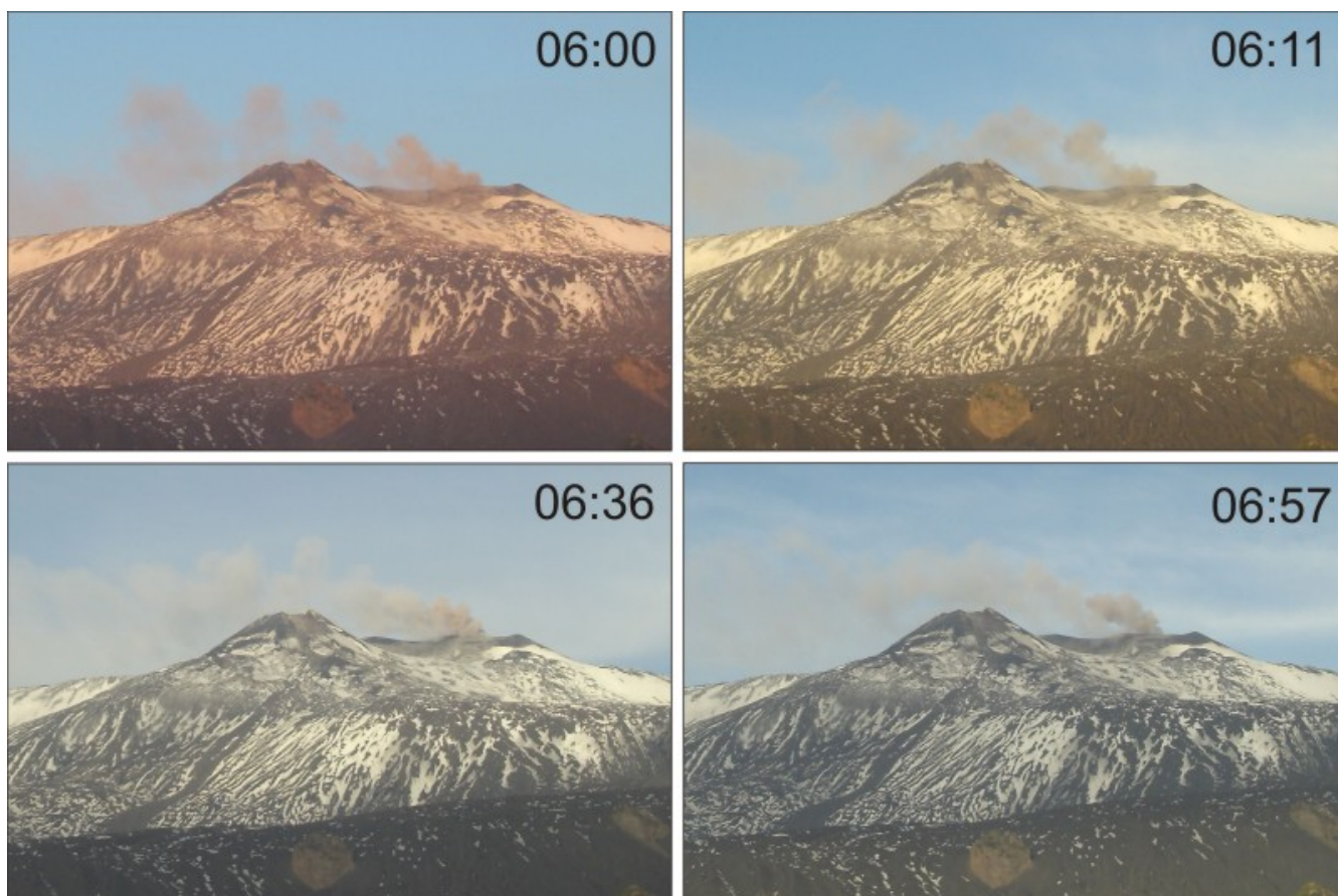
Fig. 1.2 - Emissione di piccole quantità di cenere marrone dal Cratere di Nord-Est nel mattino del 9 febbraio 2016, registrata nelle immagini della telecamera visiva ad alta risoluzione posta a Monte Cagliato, sul versante orientale dell'Etna.