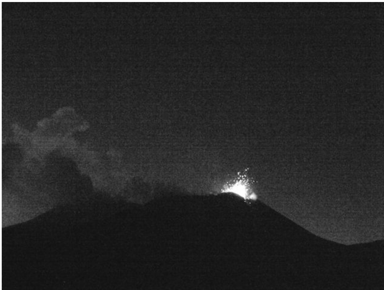
Fig. 1.2 - L'attività strombolina del Nuovo Cratere di SE vista dalla telecamera HD de La Montagnola, il 11 giugno alle 19:14UTC.

Nella serata del 14 giugno 2014 l'attività stromboliana subiva un repentino incremento d'intensità e frequenza, caratterizzata da esplosioni quasi continue e getti di lava pulsanti. Nelle prime ore del 15 giugno l'attività passava rapidamente da stromboliana a fontane di lava pulsanti accompagnate dall'emissione di cenere fine e diluita. Un trabocco lavico dall'orlo sud-orientale del cratere veniva osservato poco dopo le 6.00 UTC del 15 giugno in concomitanza con l'aumento dell'intensità dei getti di lava. Percorrendo la fenditura apertasi sul fianco del cono del NSEC, la lava formava una colata che scendeva lungo la parete occidentale della Valle del Bove.