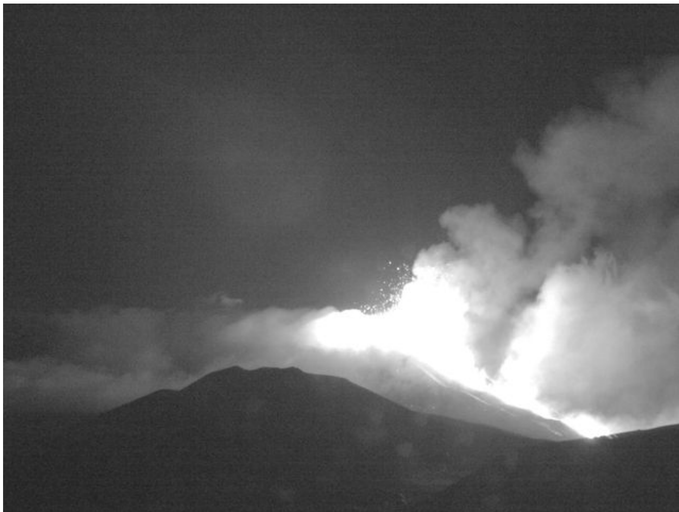
Fig. 1.3 - Le fontane di lava del Nuovo Cratere di SE vista dalla telecamera HD de La Montagnola, il 15 giugno alle 19:13UTC.