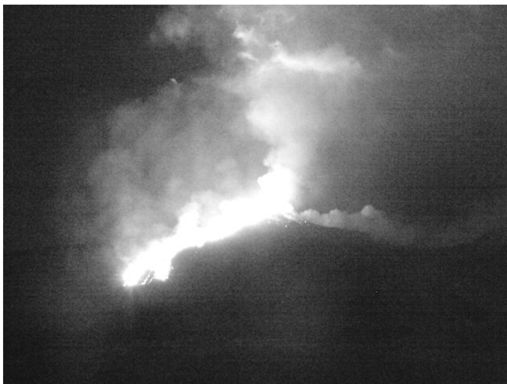
Fig. 1.4 - Le fontane di lava e la colata di lava in Valle del Bove vista dalla telecamera HD d M. Cagliato, il 15 giugno alle 23:52UTC.