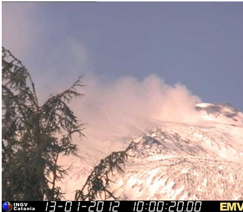
Fig. 1.2 - Immagine dei crateri sommitali ripresa il giorno 13 gennaio dalla telecamera INGV ubicata a Milo, nella quale si osserva il degassamento abbastanza intenso dal cratere di NE.