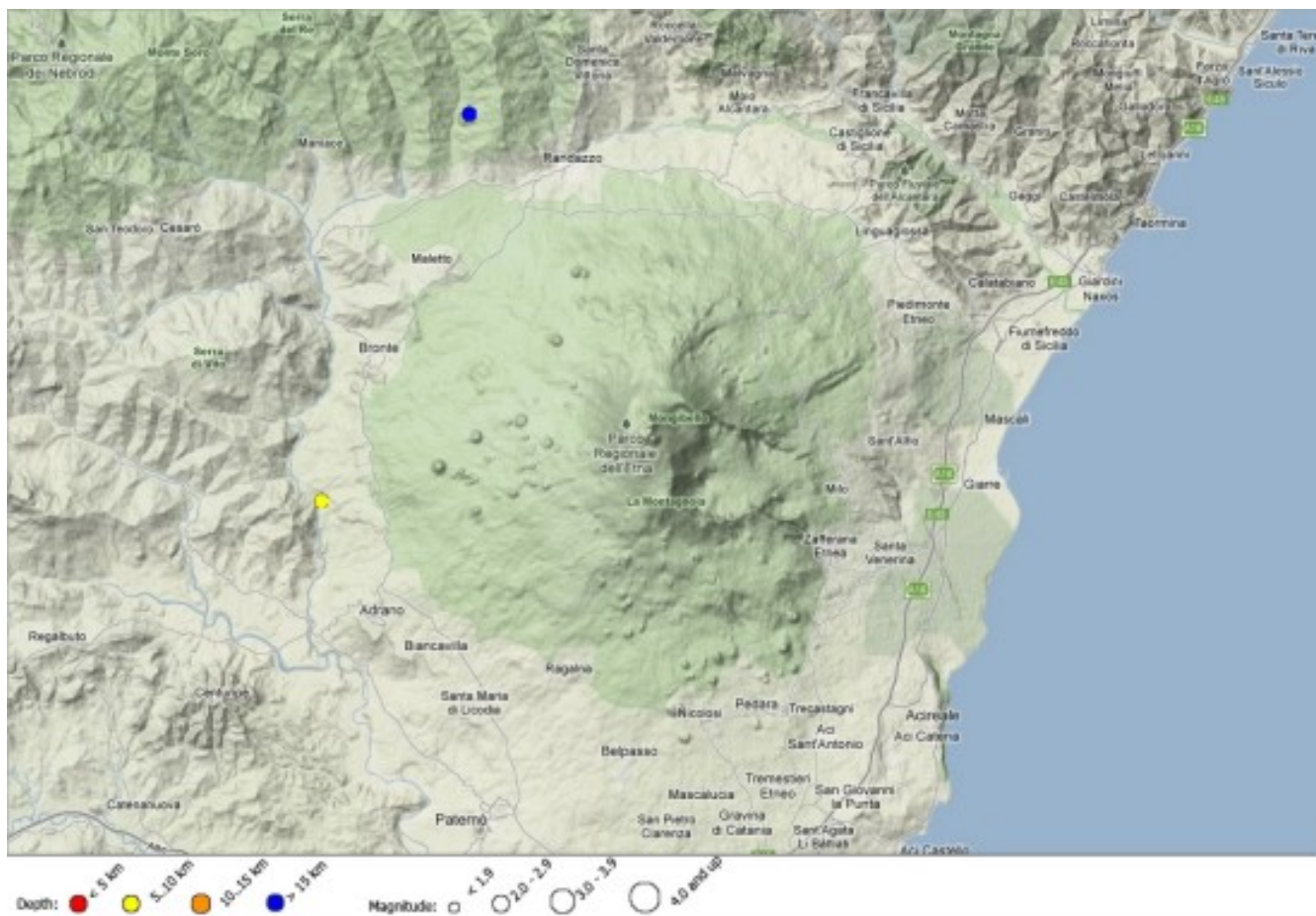
Fig. 3.2 - Mappa della sismicità localizzata nella settimana 9-15 gennaio 2012.

Per quanto riguarda i segnali sismici riconducibili alla dinamica dei fluidi magmatici all'interno dei condotti vulcanici, è stata osservata una sostanziale stazionarietà dell'ampiezza media del tremore. In particolare, l'ampiezza RMS, dopo il forte incremento associato al parossismo del 5 gennaio, si è mantenuta ad un livello medio - basso, mostrando solo deboli oscillazioni. Anche la localizzazione dell'area sorgente del tremore è rimasta abbastanza stabile e confinata all'interno di un volume posto ad una profondità di circa 1000-1500 metri sopra il l. m., in un'area compresa tra il Cratere di NE e i Crateri Centrali.