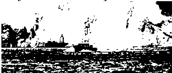
Sopra, la spiaggia di Lipari dove è avvenuto il crollo di un costone e gli ombrelloni abbandonati dai bagnanti in fuga. Sotto, la serie di frane determinate dalla scossa sismica, viste dal mare

La roccia frana sui bagnanti, tutti illesi. Schifani: «Ero in barca a pochi metri dal crollo»